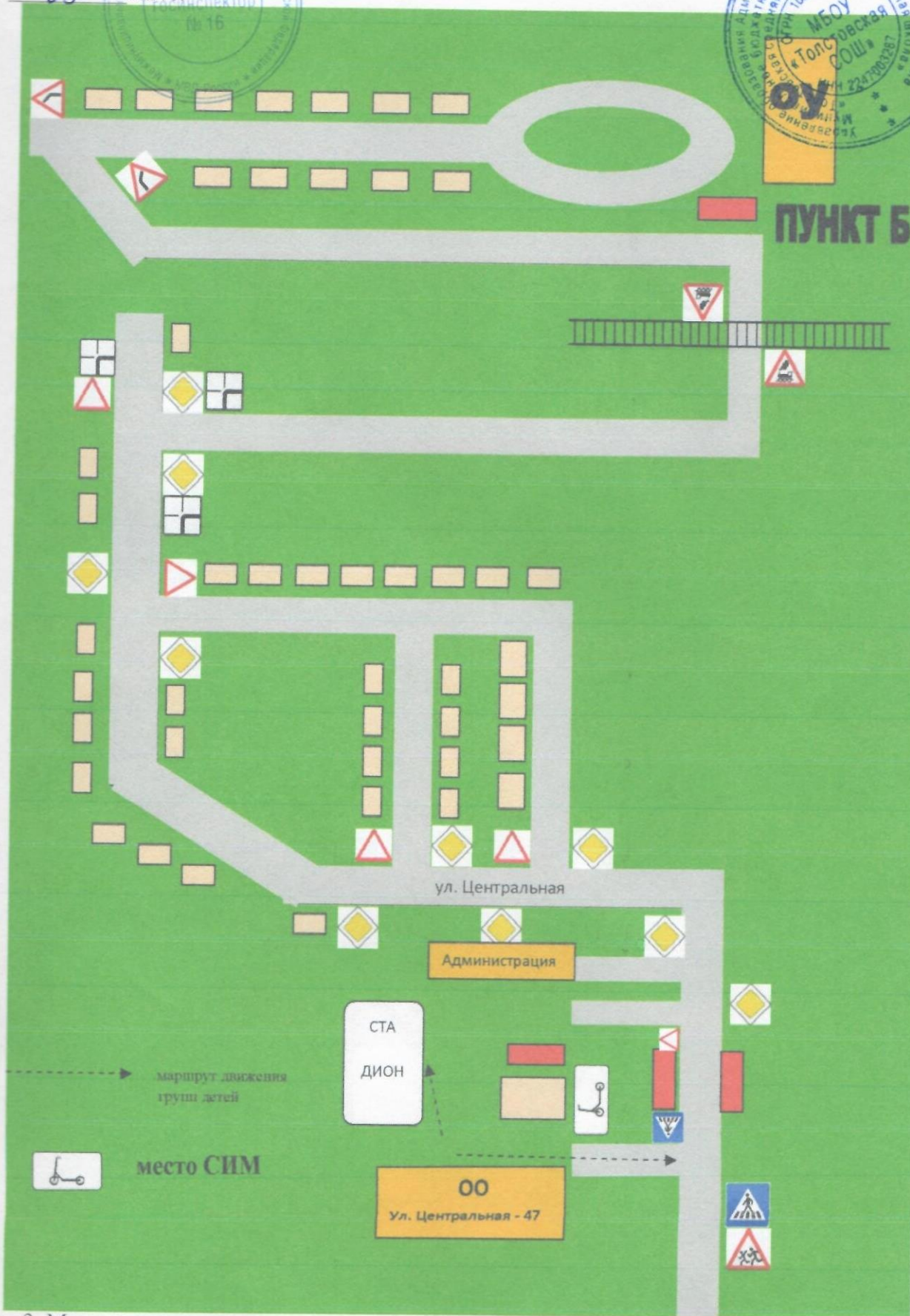
3. Маршрут движения организованных групп детей от образовательной организации к стадиону