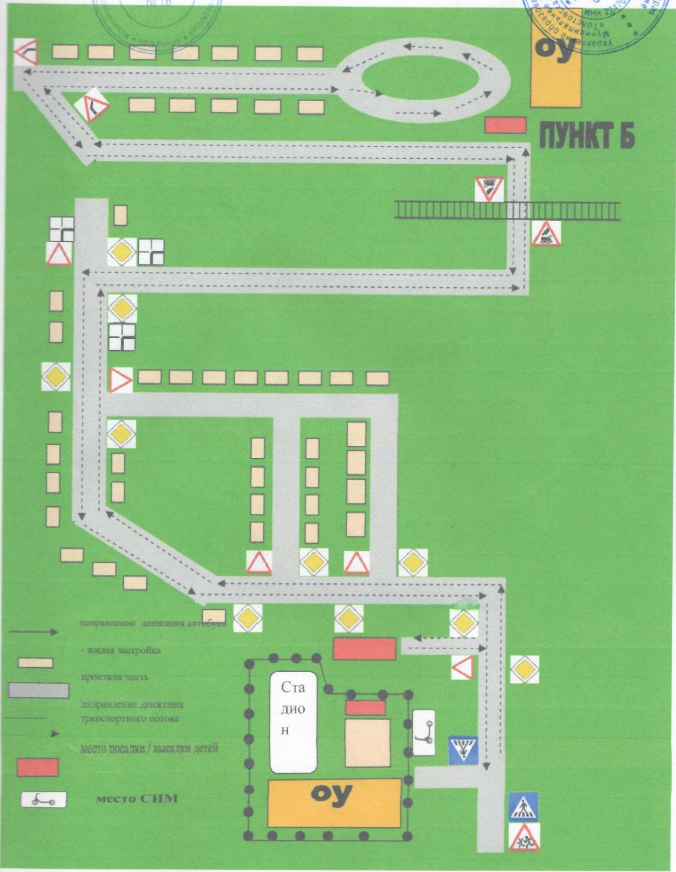
4. Схема организации дорожного движения в непосредственной близости от образовательного учреждения с размещением соответствующих технических средств, маршрута движения детей вблизи ОУ.