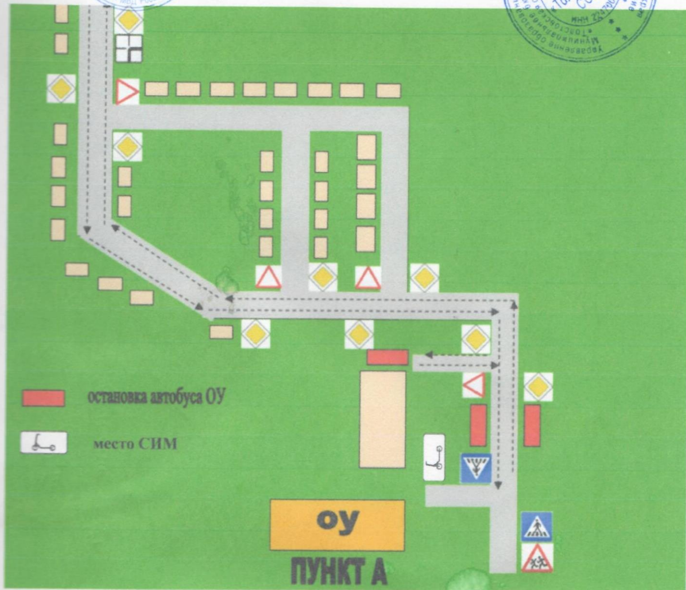
5. Безопасное расположение остановки автобуса ОУ